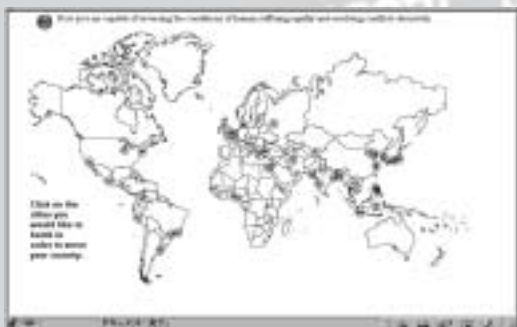
『アート・オン・ザ・ネット 2002』展より アリ・ミハルビ(トルコ)

町田市立国際版画美術館が1995年に開始したインターネット・アートのプロジェクト、『アート・オン・ザ・ネット展』は、インターネットのアーティスト的な表現スペースとしての可能性を探る試みとして、今日までの9年間、毎年異なったテーマのもとで展覧会を開催してきました。その間、インターネット上で展示された作品だけでも35カ国／地域からの346点にのぼり、また、年間100カ国以上の国々からの訪問者の方々をサーバへお迎えしてきました。