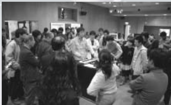
『デジタル・インターコネクション 2004』会場風景