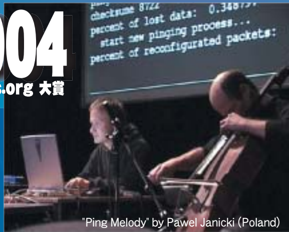
"Ping Melody" by Pawel Janicki (Poland)